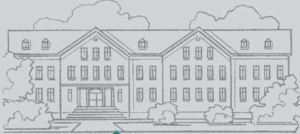
maison de repos